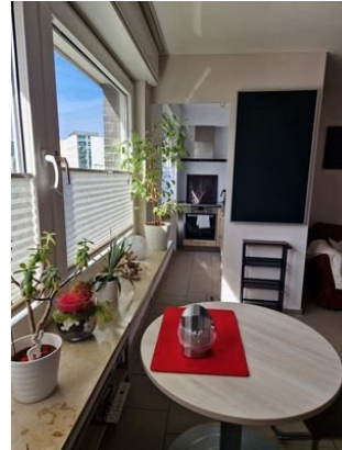
Wohn-/Schlafbereich Blick zur Küche